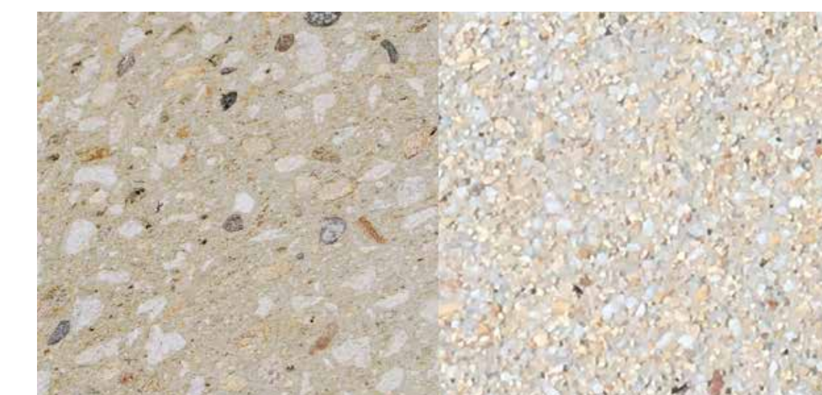
Dalles béton coulé (cœur de la place Soult)