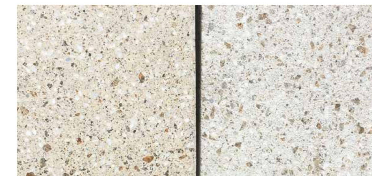
Dallage modulaire béton (les contre-allées)