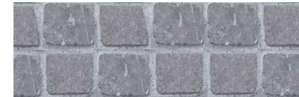
Pavé pierre calcaire (le pied de façade)