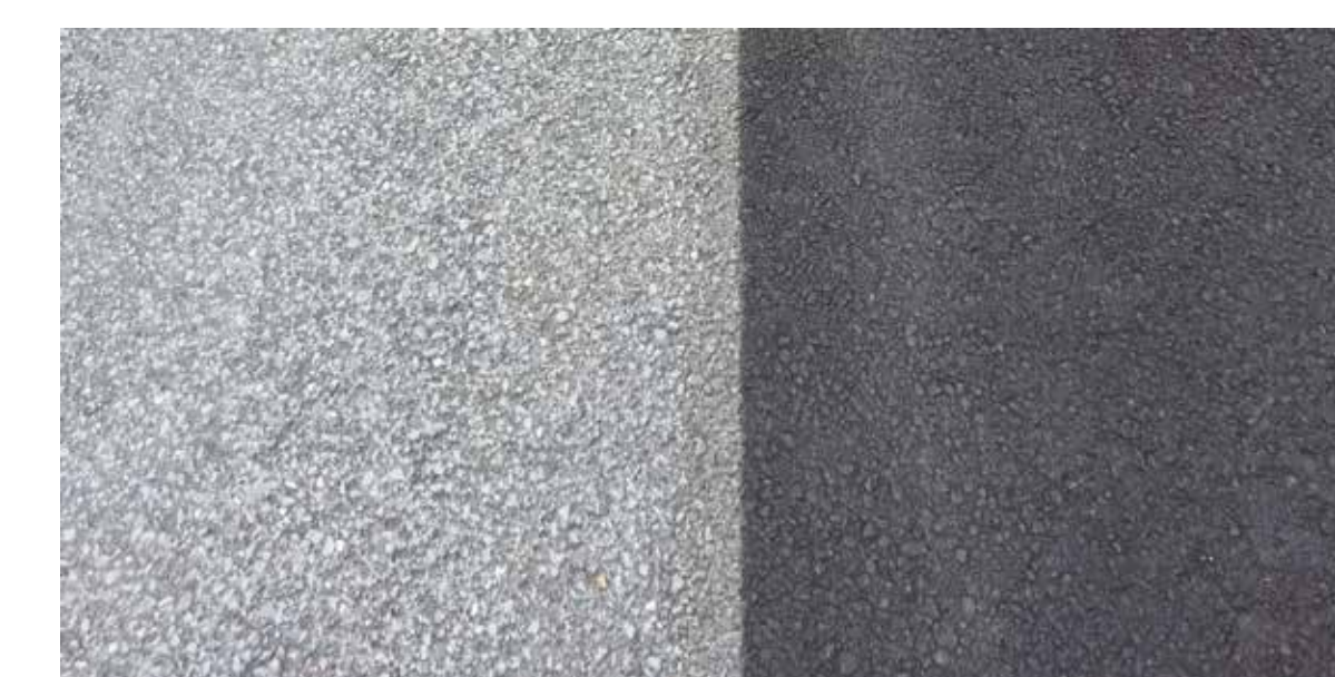
Enrobé grenailé (chaussée)